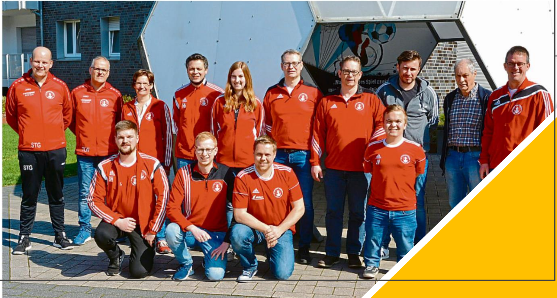
SC Rot-Weiss Nienborg 1923 e.V. - vereinskonzzept